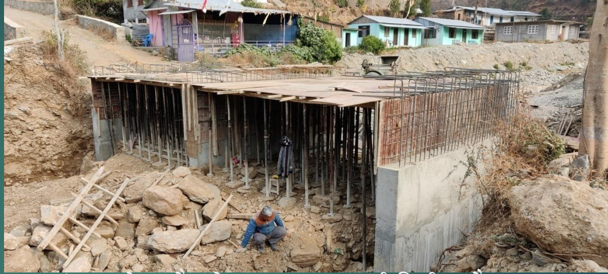
वडा नं. २ को सुकौराखोलामा बक्स कल्भर्ट निर्माण हुदै