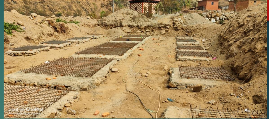
श्री वत्सलादेवी मा वि इन्द्रसरोवर ३ मा छात्रावास निर्माण हुदै