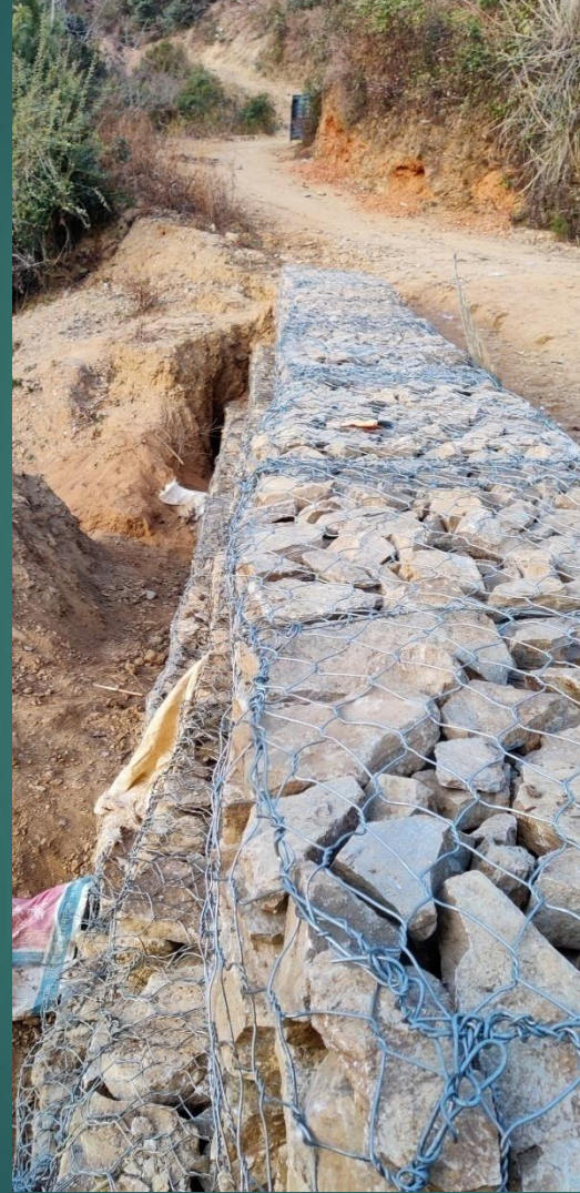
वडा नं. १, महालक्ष्मी आधारभूत विद्यालय