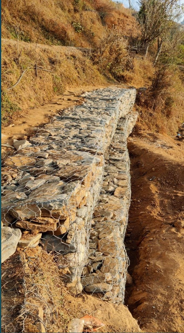
वडा नं. १, सिम्लाङ्ग बज्रमाठ ट्रेकिङ्ग ट्रेल