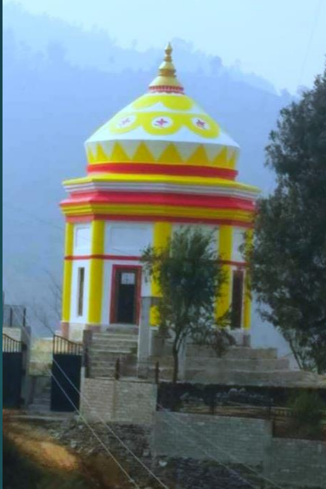
वडा नं. १ स्थित सिम्लाङ्गमा लक्ष्मी नारायण मन्दिरको नयाँ रङ्ग लगाएपछिको अवस्था