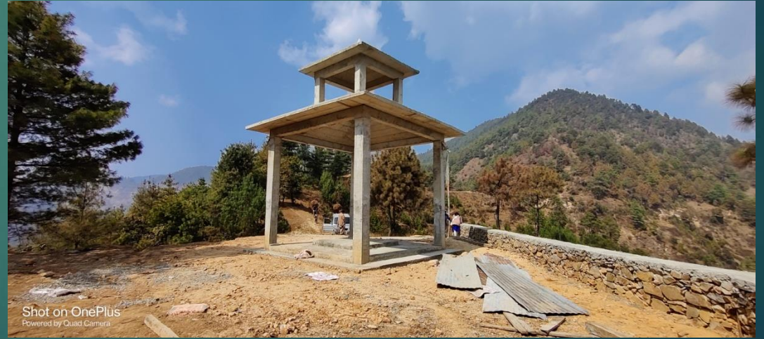
वडा नं. ४ हुमाने नजिक समाधिस्थल तथा पाटीको निर्माणधिन अवस्था