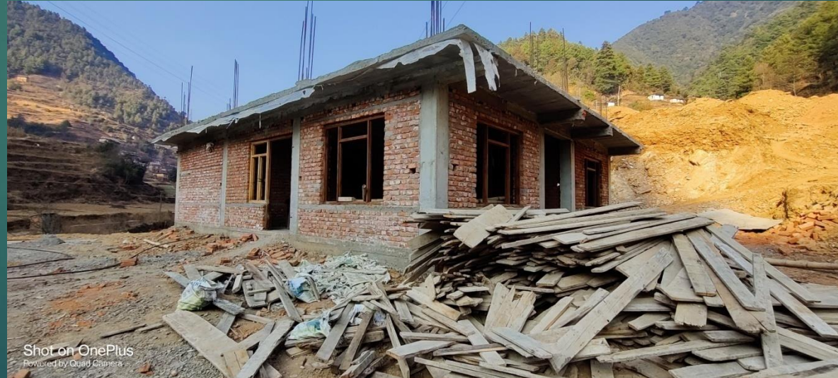
निर्माणधिन वडा कार्यालय भवन वडा नं. ५